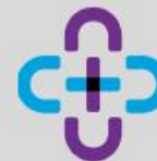
TABLE NATIONALE DES CORPORATIONS DE DÉVELOPPEMENT COMMUNAUTAIRE